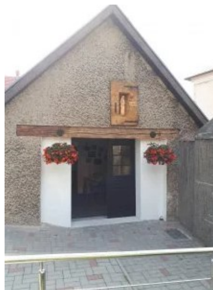
Albergue w Toszku

Niedziela i święta: 7:30, 9:00, 10:30, 12:00, 18:00